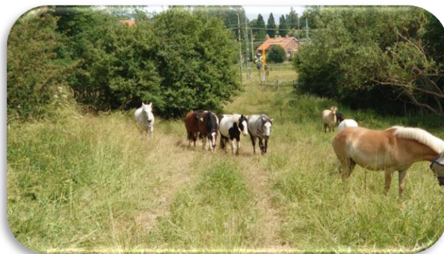
Våra skolhästar får varje år ett långt och härligt sommarbete under juni och juli månad.

Vi vill att alla ska känna sig delaktiga och välkomna i föreningen, oavsett hur länge man har ridit och vilken ambitionsnivå man har. Vi strävar efter att alltid vara hjälpsamma mot varandra och vi försöker ta extra väl hand om våra små ryttare och nya medlemmar. Vi ska visa omtänksamhet och respekt mot varandra och hästarna.